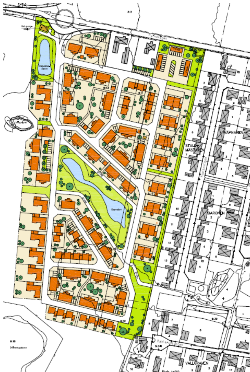
Illustration Lloyd arkitekter och Stadsbyggnadskontoret Lunds kommun

Ett genomförande av detaljplanen möjliggör uppförande av cirka 175 nya bostäder.