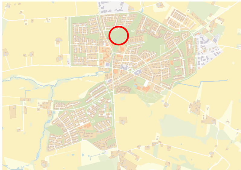
Södra Sandby, översiktskarta med planområdets läge rödmarkerat.

Planläggning av del av Sandby 67:2 för att möjliggöra avstyckning och förvärv av centralt belägen fastighet, del av Sandby 64:1, kan på sikt innebära att barns bästa kan beaktas vid utveckling av Södra Sandby. Beslut om planuppdrag bedöms inte påverka barn och konsekvensanalys är därför inte aktuellt i ärendet för tillfället.