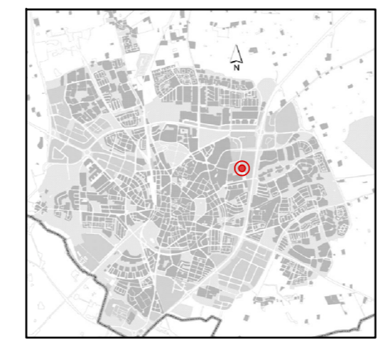
Orienteringskarta över Lund