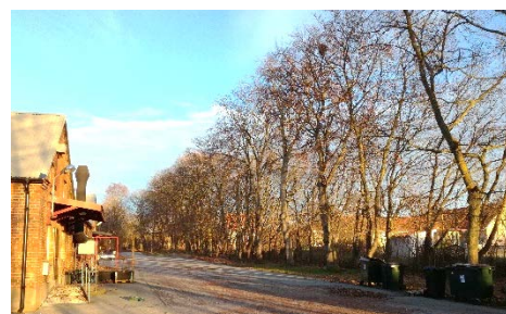
Omgärdande trädader, bok m fl trädslag