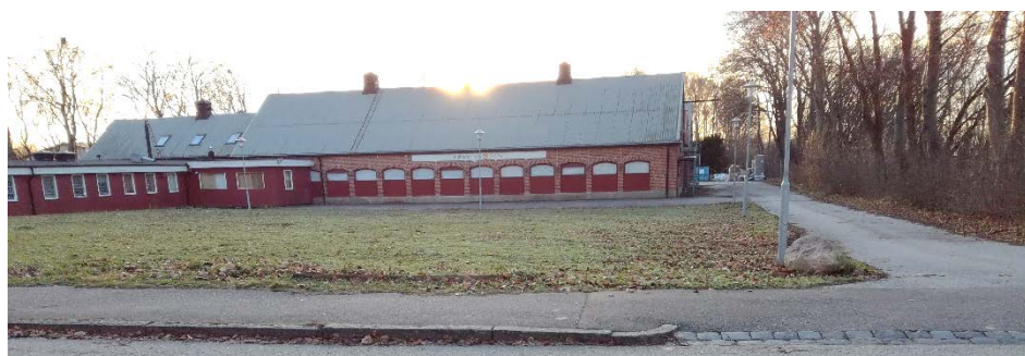
Befintlig bebyggelse inom Tjugan 2, vy från norr vid en av infarterna