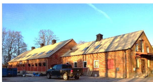
Befintlig bebyggelse sedd från söder