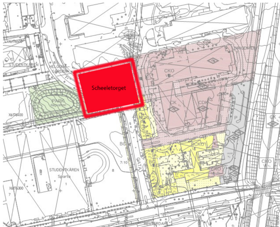
Det nya entrétorget, Scheeleorget.