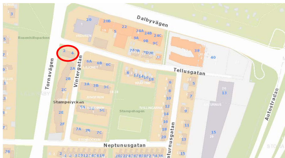
Orienteringskarta med planområdet rödmarkerat.

Bostadsrättsföreningen Vintergatan inkom 2019-02-18 med ansökan om upprättande av ny detaljplan för del av Orion 4 i Lund. Syfte med ny detaljplan är att möjliggöra bostäder och centrumverksamhet i befintlig butikslänga. Butikslängan i ett våningsplan bedöms kunna omvandlas till två eller tre bostadslägenheter. För planområdet gäller idag stadsplan 1281K-77-C856 från 1948 som medger handelsändamål i en våning med en byggnadshöjd på 4 meter.