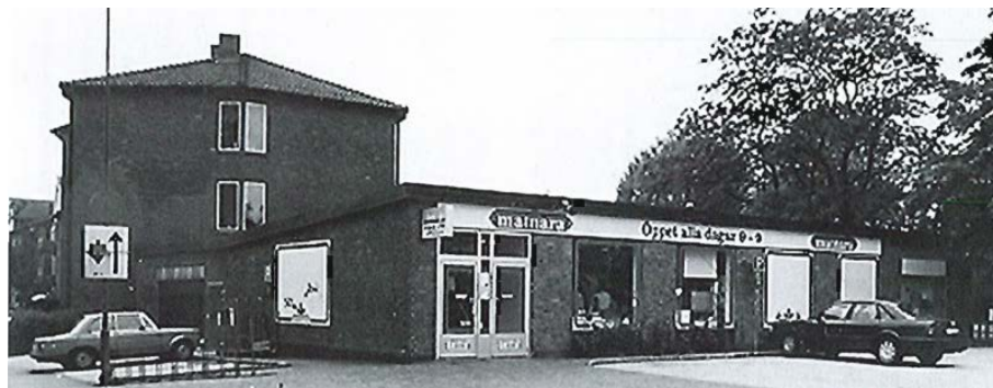
Butikslängan mot Tellusgatan i norr (Lunds bevaringsprogram).

Förslag till ny detaljplan innebär att två till tre bostäder möjliggörs inom befintlig yta för handel. Planområdet berörs inte av några regleringar eller skyddsvärden och bedöms inte heller innebära några negativa effekter på miljö, hälsa eller hushållningen med mark, vatten eller andra resurser. Det föreslås därför att en formell miljöbedömning inte genomförs enligt miljöbalken.