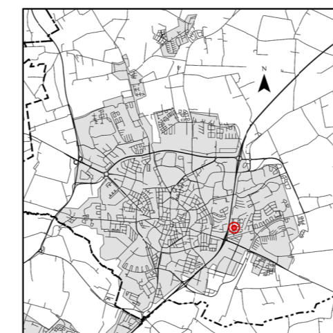
Orienteringskarta över Lund