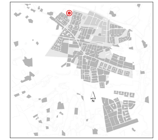
Orienteringskarta över Veberöd