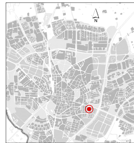
Orienteringskarta över Lund