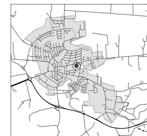
Orienteringskarta över Dalby