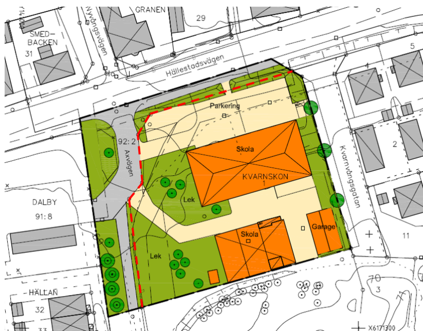
Planområdet inom svart streck/prick markering, fastigheten Kvarnskon 1 inom röstreckad markering.

Stadsbyggnadskontoret anser att förutsättningarna i plan- och bygglagen för antagande av detaljplanen är uppfyllda och föreslår att byggnadsnämnden beslutar att anta detaljplanen.