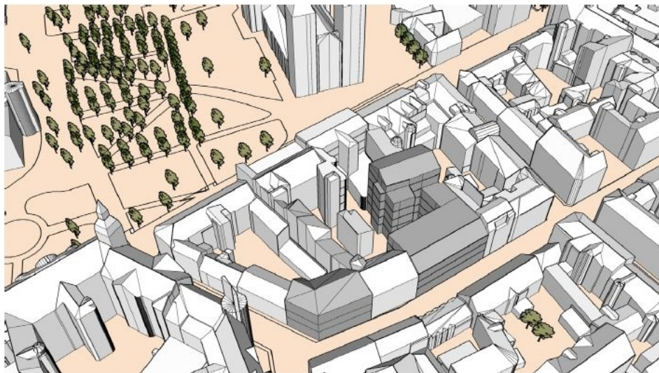
Volymstudie sett från nordväst. Mörkgrå volymer är nya.

Stadsbyggnadskontoret har i en volymstudie tittat på vilka möjliga byggnadsvolymer som kan tillskapas inom det aktuella området. Det förslag som är aktuellt i ansökan om planbesked innebär att en volym med 3 våningar samt inredd vindsvåning placeras mot Klostergatan och att en högre volym på 6 våningar placeras längre in i områdets mitt. De kulturhistoriska värdena hos befintligt stadshus och dess gårdsrum respekteras. Förslaget innehåller ca 4000 kvm ny BTA.