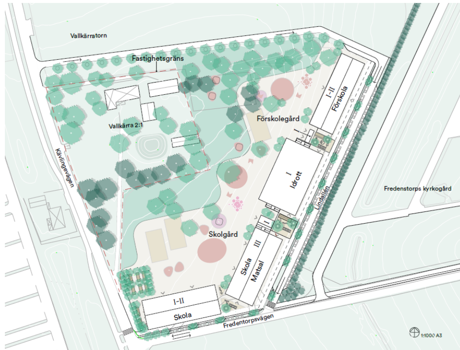
Förslag till situationsplan framtagen av FOJAB.

Skolan föreslås placeras centralt inom fastigheten Vallkärratorn 5:75, mellan Kävlingevägen och befintlig gård i väster, Fredentorps kyrkogård i öster samt norr om Fredentorpsvägen. Skolbyggnader föreslås placeras i områdets östra och södra del i syfte att verka bullerdämpande från järnvägen mot skolans utemiljö.