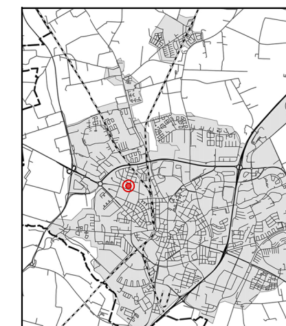
Orienteringskarta över Lund