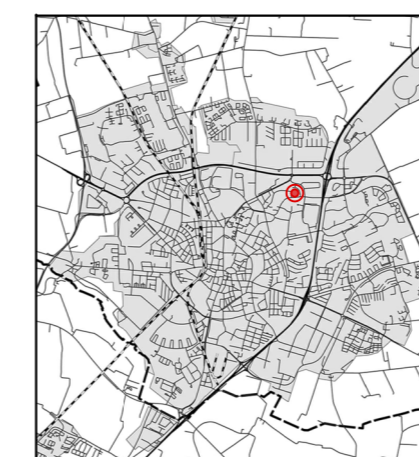
Orienteringskarta över Lund