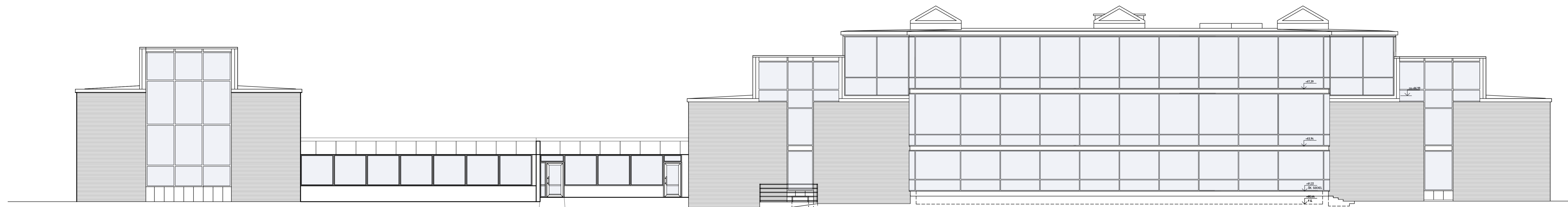
FASAD MOT SÖDER BYGGNAD - A -