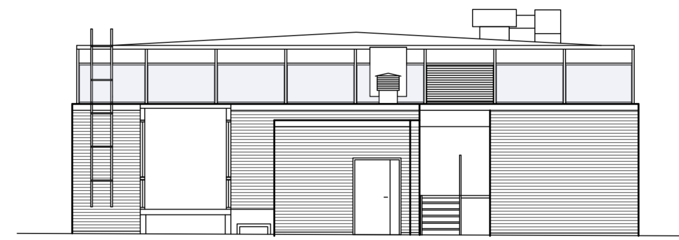
FASAD MOT ÖSTER BYGGNAD - E -