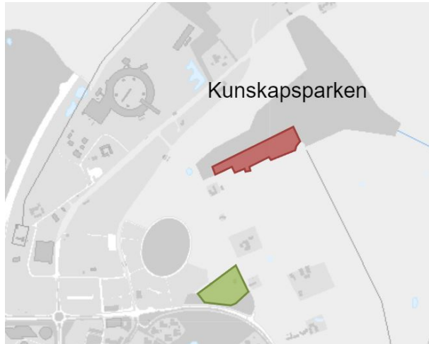
Figur 1 – Översiktskarta över nordöstra utkanten av Lund, med Kunskapsparkens nya odlingsområde i rött och nuvarande odlingslotsområde på Brunnhög i grönt.

grupper som varit knutna till Brunnhögs temporära odlingsområde. Dialog med odlare och odlingsförening kring detta har pågått sedan 2017. Bland annat genom work-shops och i ett långtgående samarbete kring gestaltning, projektering och framtida skötselsamarbete i odlingsområdet.