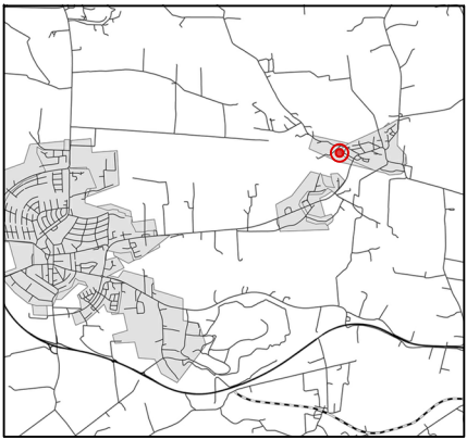
Orienteringskarta Dalby och Torna Hällestad