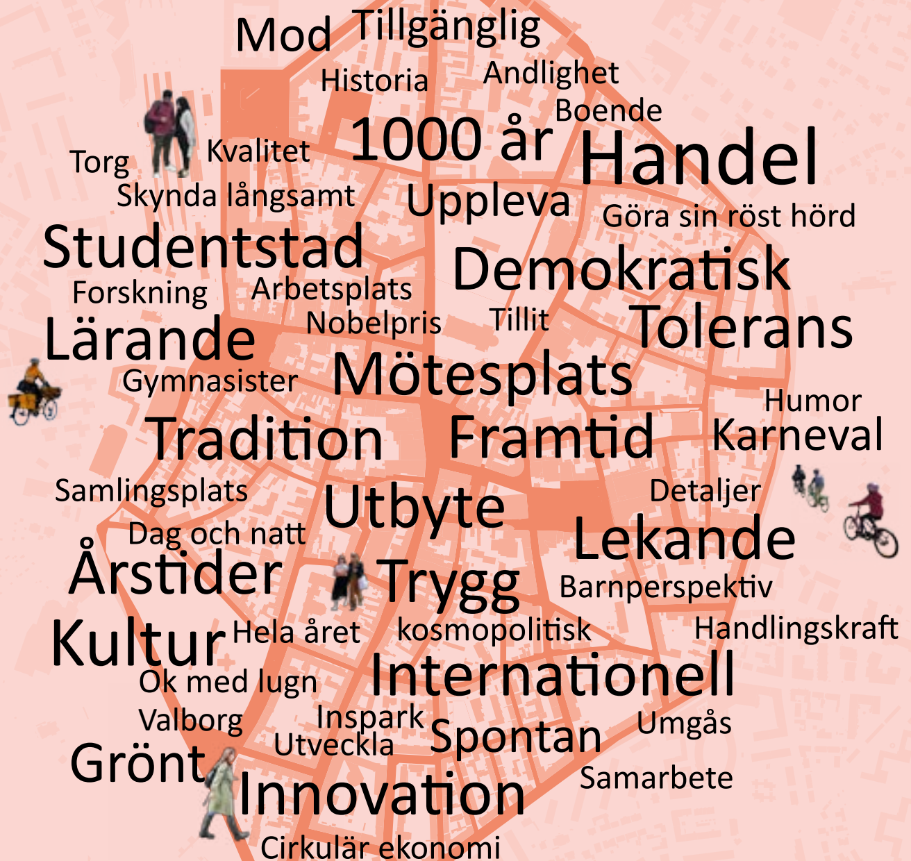
Nyckelord från dialogprocessen kring stadskärnans utveckling, Lund 2023