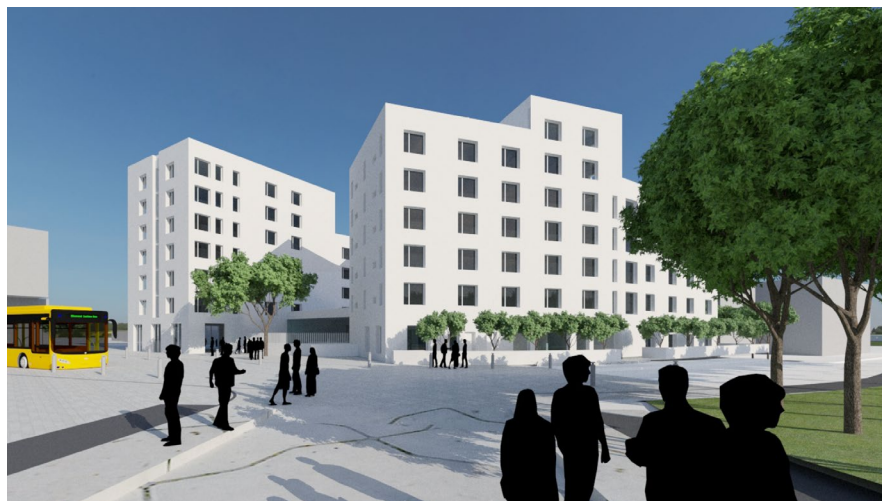
Visualisering från nordväst (White arkitekter). Bilden redovisar den föreslagna nya bebyggelsen, entréplatsen och omgestaltningen av del av Ole Römers väg.

Planområdet är cirka 0,7 hektar stort och planförslaget innehåller cirka 200 studentbostäder och cirka 1000 kvm BTA verksamheter (nationslokaler) i bottenvåningen. Den föreslagna nya bebyggelsen bildar ett slutet kvarter med en skyddad innergård. Bebyggelsen i kvarteret ska förses med entréer mot omgivande gator och stråk. En lokal för studentnationen föreslås placeras i bottenvåningen mot befintligt gång- och cykelstråk i öster och mot den föreslagna nya platsbildningen i norr. Även om kvarterets bebyggelse hänger samman så har den också brutits upp i flera individuella byggnadsvolymer med varierande höjder. För området gäller ramprogram för Ideon och Pålsjö företagsområde. De ovan