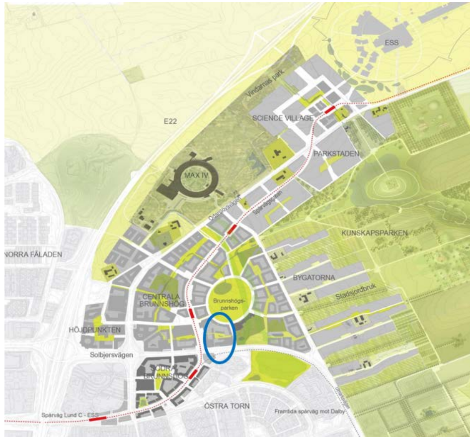
Figur 1 . Område för de aktuella byggrätterna i centrala Brunnsnäs markerad med blå ring.

flerbostadshus och Nobelparken planeras att börja byggas under 2019. Målet är att uppemot 400 bostäder per år ska byggas i området.