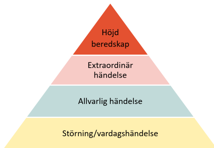
Figur 1. De fyra risknivåerna i krisledningsarbetet

Kommunens krisledningsarbete utgår från en så kallad risktriangel med fyra steg/nivåer, enligt nedan figur.