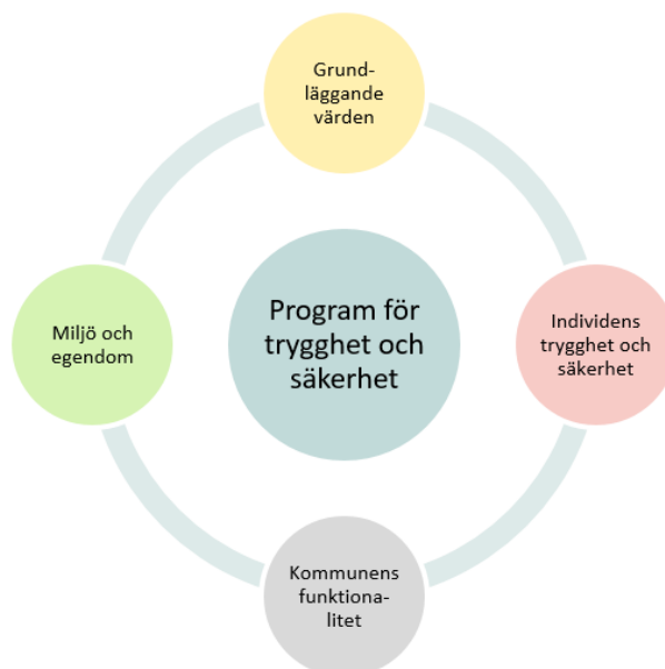
Figur 2. Fyra principer som programmet för trygghet och säkerhet vilar på

Lunds kommuns program för trygghet och säkerhet utgår från nationella viljeinriktningar för säkerhet och bedrivs för att värna fyra vägledande principer, som framgår av modell nedan.