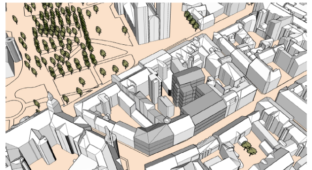
Illustration: möjlig tillbyggnadsvolym på Altona 1