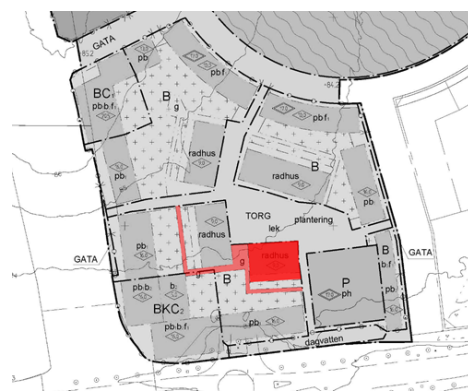
Lund Jane Addams 4