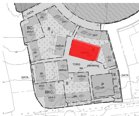
Lund Marie Sklodowska Curie 3

För att säkerställa att Gatuhus i Brunnsnög AB i största möjliga mån följer sitt inlämnade tävlingsförslag har "Hållbarhets-PM Brunnsnög" med åtgärdsförslag fyllts i av Gatuhus i Brunnsnög AB och bilagts till köpekontraktet, se Bilaga 2 under kolumnen "vad byggherren ska bidra med".