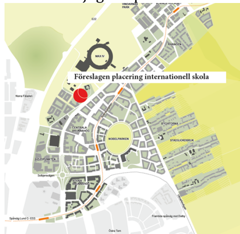
La Strada-området föreslagen placering av internationell skola

I fördjupad översiktsplan för Brunnsnäs är La Strada-området beskrivet som sekundärt utbyggnadsområde. Utbyggnaden inom den närmaste tjuugoårsperioden kommer primärt att ske inom 300-meterszonerna kring de tre prioriterade spårvagnshållplatserna. Dock krävs ett visst handlingsutrymme vilket kan innebära en smärre utbyggnad inom sekundära utbyggnadsområden även under den första tjuugoårsperioden.