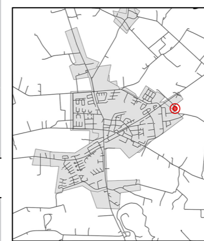
Orienteringskarta över Södra Sandby