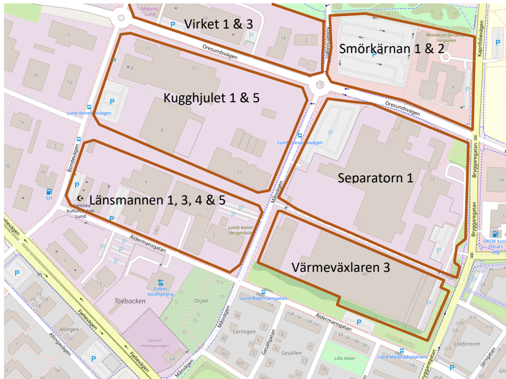
Figur 2. Situationsplan för Smörkärnan samt intilliggande kvarter.

I Figur 2 visas Smörkärnan och närliggande fastigheter inom etapp 1.