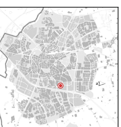
Orienteringskarta över Lund