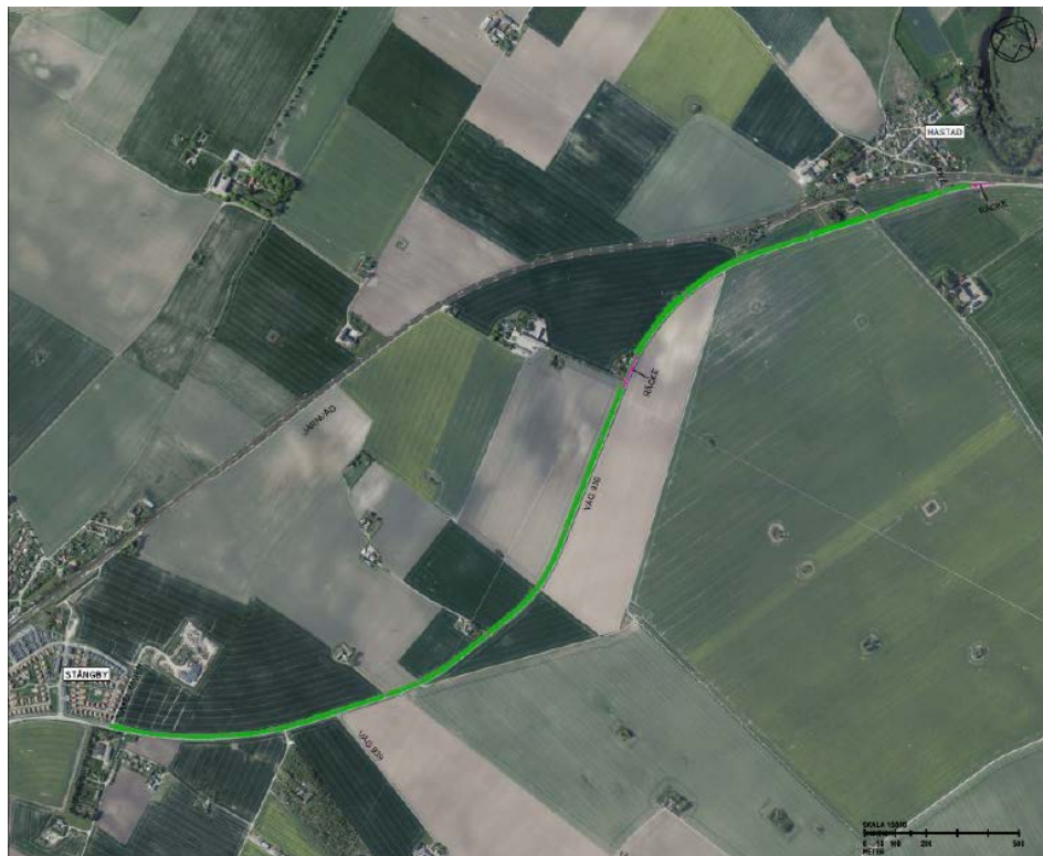
Figur från samrådshandlingen som visar vald sträckning.

Den föreslagna åtgärden omfattar en anläggning av cirka 3,5 kilometer lång separerad gång- och cykelväg mellan Stångby och Håstad. Tidigare utredning har landat i ett förslag för en gång- och cykelväg längs med väg 936, i enlighet med kommunens önskemål. Gång- och cykelvägen utformas som en friliggande gång- och cykelväg med 3 meters bredd. Mellan gång- och cykelvägen och väg 936 skapas ett dike för avvattning och separering. Generellt är avståndet från gång- och cykelväg till väg 4,40 meter. Där ett avstånd på minst 2 meter inte kan uppnås separeras gång- och cykelvägen från vägen med räcke.