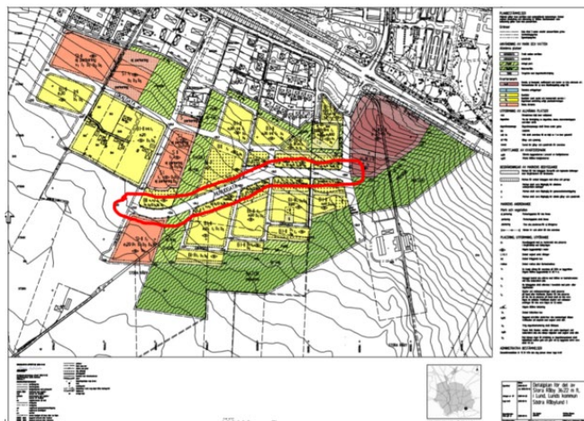
Södra Råbylund etapp 1

Rödmarkerat ingår i detta igångsättningstillstånd