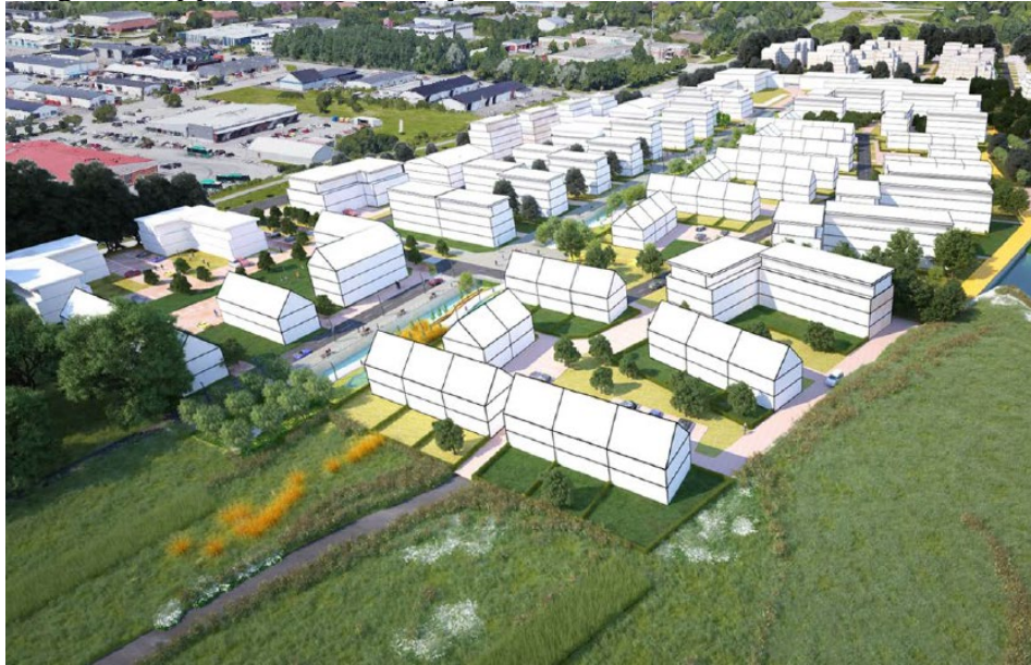
Illustration av uppdragsområdet. (Illustration: Stadsbyggnadskontoret)

Gatuutformningen kommer delvis att baseras på utformningen i tidigare etapper av Södra Råbylund.