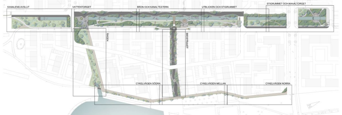
Fördjupad gestaltning av kanalen, grönytor och torgytor

En central tanke i planen är att synliggöra dagvatten genom att ersätta befintlig dagvattenkylvert med en kanal som planeras gå centralt genom området från norr till söder. En fördjupad gestaltning av projektområdet har nyligen utförts. Denna gestaltning kommer att vara en tydlig utgångspunkt för detaljprojekteringen där den kommer att bearbetas på en mer detaljerad nivå.