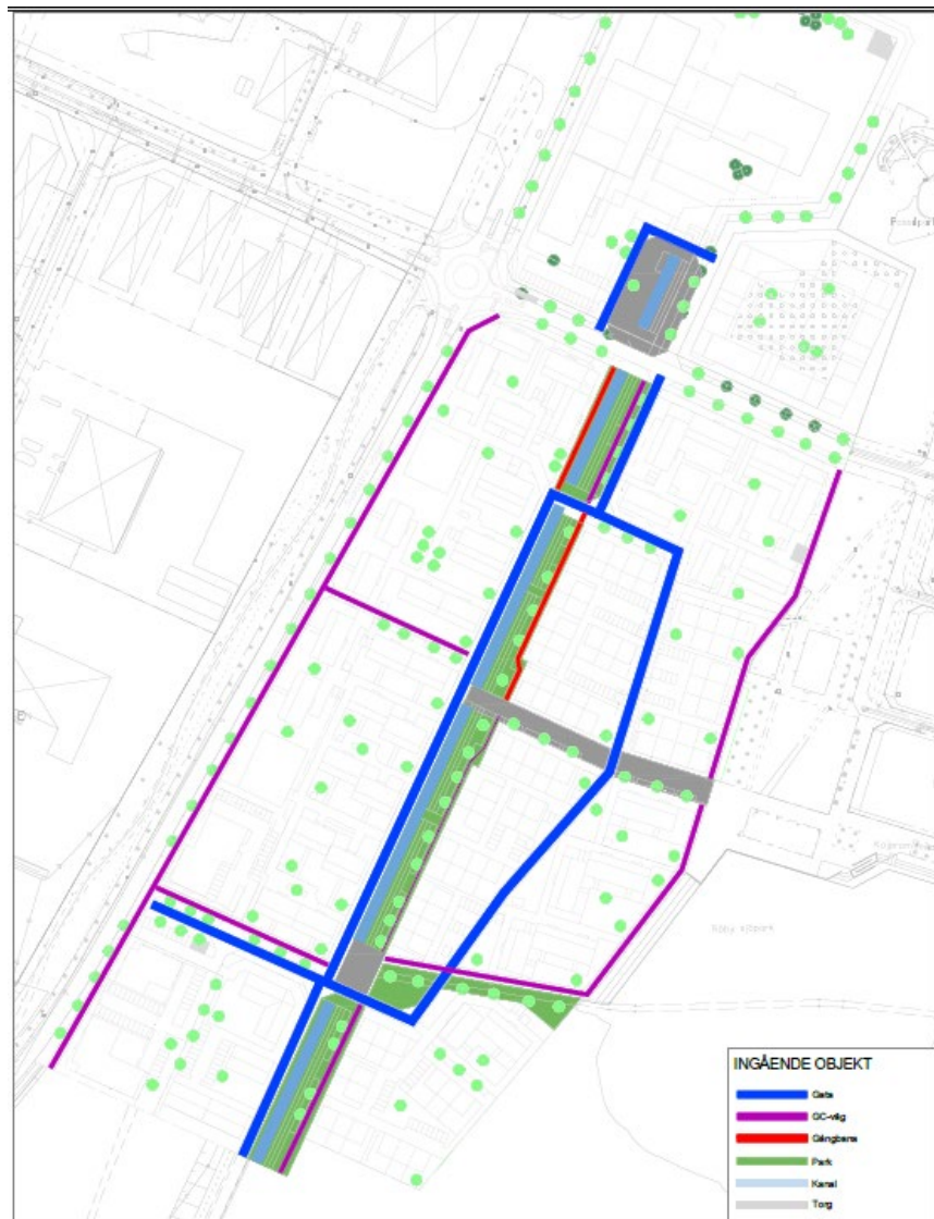
Gator, gc-vägar, torgytor, kanal och parkmark inom planområdet