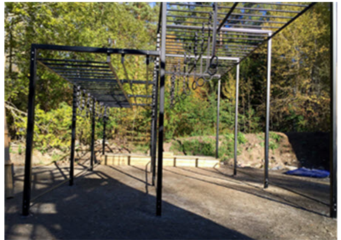
Bilaga: Rigg för armgång och ringar.jpg