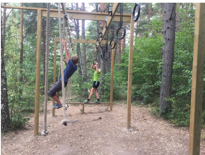
Bilaga: Rigg rep och ringar.jpg