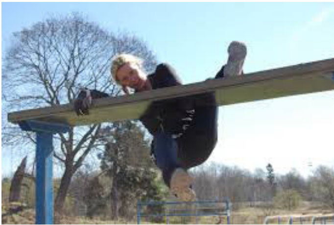
Bilaga: Irländskt bord.jpg