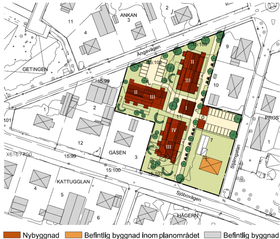
Illustration Jaenecke arkitekter.

Stadsbyggnadskontoret har upprättat förslag till detaljplan. Syftet är att pröva lämpligheten av ny bostadsbebyggelse på fastigheterna Gåsen 4 och 11 i två, tre och fyra våningar samt en centralt belägen byggnad i en våning avsedd för gemensamhetslokal och gästlägenhet. Befintlig huvudbyggnad på fastigheten Gåsen 7 mot Sjöbovägen föreslås med rivningsförbud och varsamhetsbestämmelser då den är angiven som kulturhistorisk värdefull i Lunds kommuns kulturhistoriska bevaringsprogram.