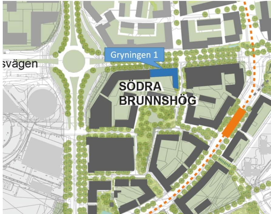
Anbudstävlingen gällde uppförande av hyresrätter på fastigheten Gryningen 1, Södra Brunnsög

uppdrag att genomföra en anbudstävling för bostadshus med hyresrättslägenheter. Ett fast pris, hållbarhetsprestanda, innovation och arkitektval var kriterier i urvalet.