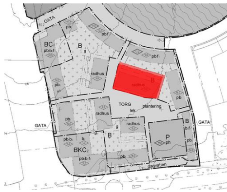
Lund Marie Sklodowska Curie 3

För att säkerställa att Gatuhus i Brunnsnög AB i största möjliga mån följer sitt inlämnade tävlingsförslag har "Hållbarhets-PM Brunnsnög" med åtgärdsförslag fyllts i av Gatuhus i Brunnsnög AB och bilagts till köpekontraktet, se Bilaga 2 under kolumnen "vad byggherren ska bidra med".