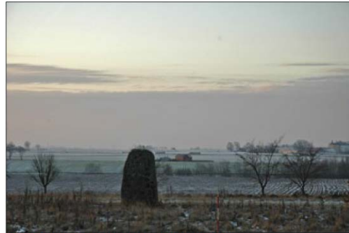
Fig. 5. "Långe Per", RAÄ 10:1 Lunds stad. Foto från norr.

Bildtext: Till vänster är hur stenen ser ut 2020. Till höger ca år 2005