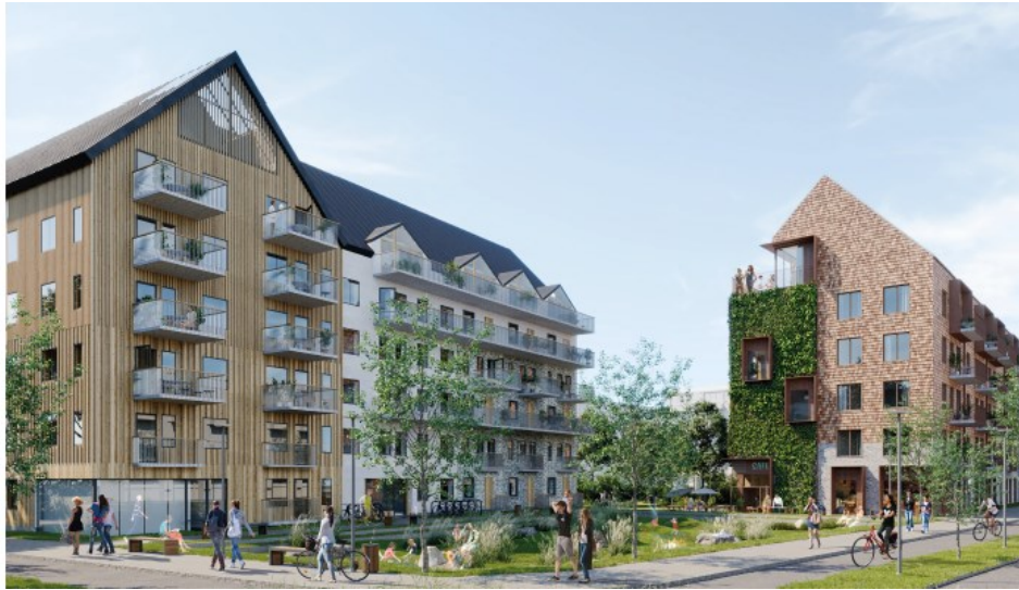
Illustration, JM AB

Hållbarhetsprestandan håller en hög nivå i form av Svanenmärkning, trästomme (i en byggnad), mobilitetskoncept med satsning på cykel, solceller, hållbar material- och avfallsstrategi, smarta hem, färskvatten-besparande åtgärder och odlingsmöjligheter. Ett av husen kommer också att ha en gemensamhetslokal på översta planet med utsikt över Brunshögstorget.