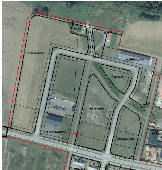
Verksamhetsområdet med plan- och användningsgränser

Man bör fundera över hur omfattande marknadsföringen av verksamhetsmark bör vara. Marknadsföring i rimlig skala är säkert positivt för Genarp. Översiktsplanen pekar dock inte ut någon ny plats för verksamhetsområde i Genarp, så när det den befintliga verksamhetsmarken inom Kärrvallen är slutsåld, finns det inte någon annan mark angiven för ny verksamhetsmark.