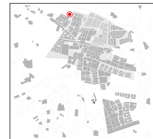
Orienteringskarta över Veberöd