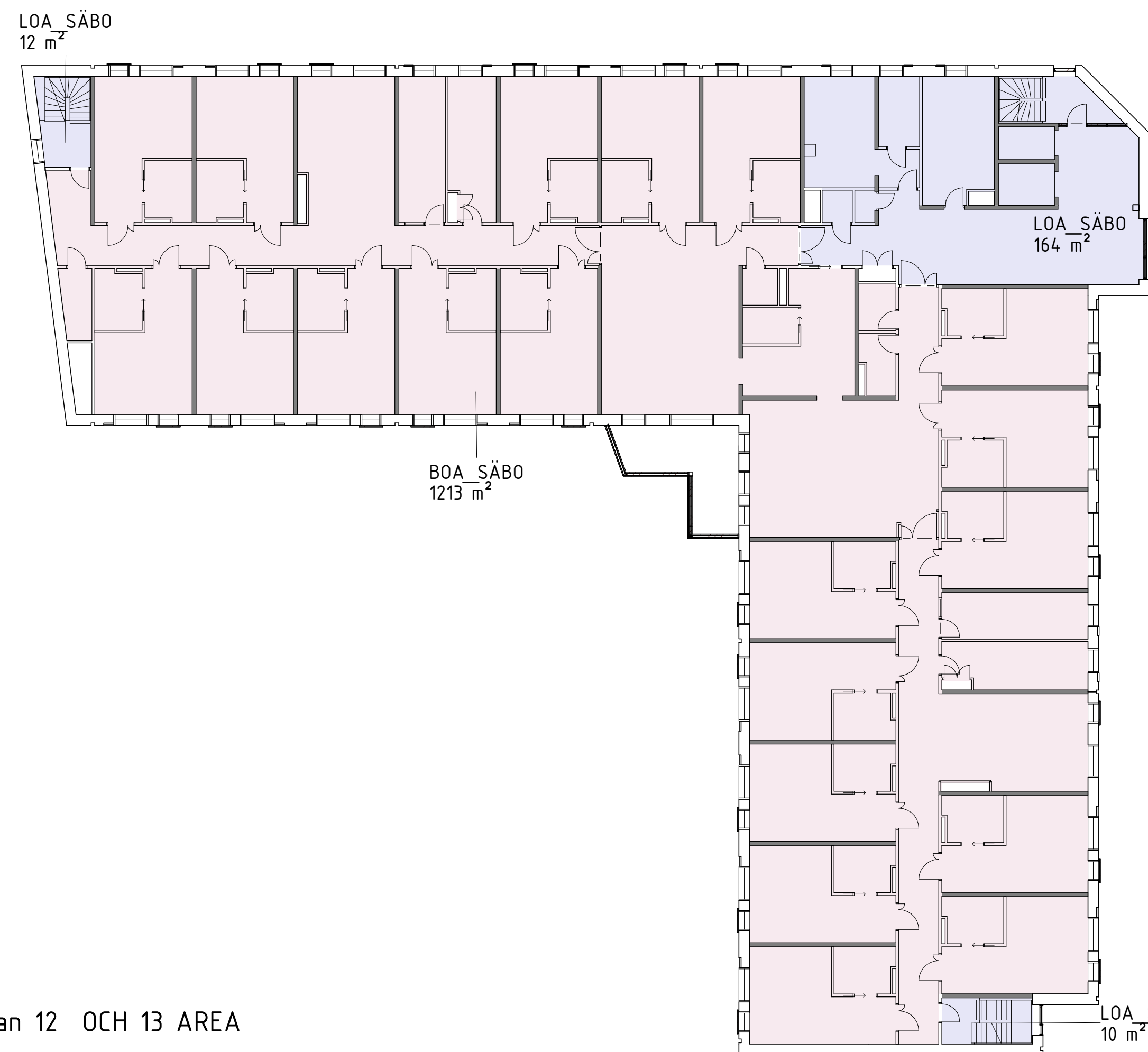
Plan 12 OCH 13 AREA